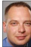
Robert Koch Presse- und Öffentlichkeitsarbeit